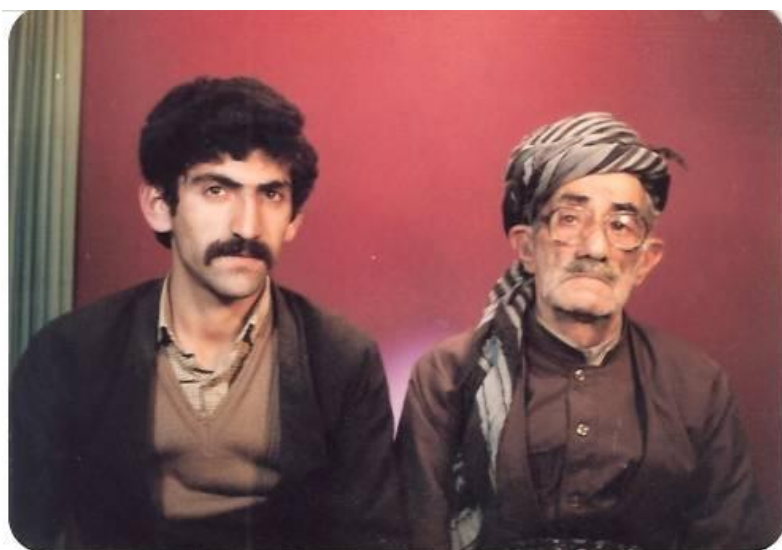
■ کوردستانی باشوور ، شاری سلیمانی، سالی ۱۳۶ هه‌تاوی ، باوکم و په‌زا