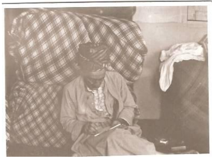
ئالمانه سالی 1354 هه‌تاوی؛ باوکم له کاتی نووسینی نامه.

گهلی کوردستان و ئیران بوو که کهوته تاریکی و چوه تاریک خانهی بیره‌وریه‌کان .