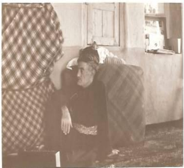
ئالمانه، سالی ۱۳۵۵ هه‌تاوی، ژووری دانیشتن .

وناسنامهی دانیشتونانی ئالمانه به دوور له ئیهانه و سوکایهتی ئاماده کرا و تهحویل دانیشتونان درا . تهنانهت کاتیکی بهرپرسیانی ئیداره‌ی توتون بهمه‌بهستی هه‌لسه‌نگاندنی ئاستی داهااتی توتون دههاتنه ئالمانه و شیوه کاریان بورۆکراسی و قرتاس بازی بوو ، دانیشتونانی ئالمانه‌ی یارمه‌تی ده‌دا، تا له ئاستیکی نزمدا، له داو و بو‌سه‌ی کاربه‌دهستانی ئیداره‌ی توتون ئه‌سیر بن . سه‌رباز گیری " ئیجباری " گیر و گرفتی نه‌بپراوه و سه‌ره‌کی گه‌نجان و بنه‌ماله‌ جووتیاره‌کان بوو. ده‌بوا هه‌ر گه‌نجیکی دیهات بو‌ ماوه‌ی دووسال به‌ خو‌پایی سه‌رباز بی‌ت و له واقیعدا به‌ هیزی چه‌ک و دیکتاتوری ، دووسال له‌ پرۆسه‌ی به‌ره‌م هه‌ینان و کشت و کال دوور ده‌خرایه‌وه . خه‌رج و مه‌سره‌فی ده‌ورانی سه‌ربازی له‌ ئه‌ستۆی سفره‌ی هه‌زارانه‌ی ماله‌ جووتیار بوو . ناوه‌ند و سه‌رچاوه‌ی داهااتی ژانداره‌کان دیهات بوو که " به‌رتیل " یان به‌ ئاشکرا وه‌ر ده‌گرت و له‌و بواره‌دا پارهی‌ه‌کی به‌رچاوه‌ه‌له‌ده‌لو‌شرا و سفره‌ی جووتیار تا ده‌هات هه‌زارانه‌تر ده‌بوو . باوکم له‌م قو‌ناغه‌دا ، ده‌خاله‌تی ده‌کرد و تا ئه‌و جی‌گایه و ئیمکانی هه‌بوو ده‌یتوانی ئاستی به‌رتیله‌کان تا راده‌یه‌کی زۆر که‌م کاته‌وه و ده‌هه‌ینایه‌ خواره‌وه . له‌م پێقا‌ژه‌یه‌دا جووتیارانی یارمه‌تی ده‌دا و پاداشی خو‌ی راسته‌وخۆ له‌ رێز و ئی‌حترام و سپاسی جووتیاران وه‌ر ده‌گرت‌ه‌وه .